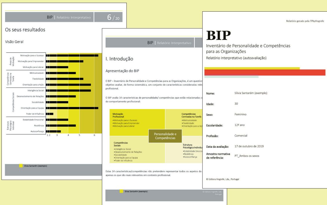
Exemplo da informação disponibilizada no Relatório Interpretativo