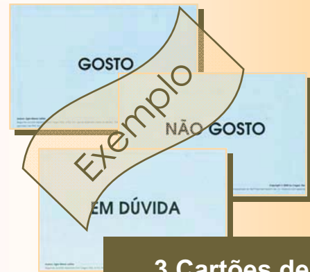
3 Cartões de Preferências