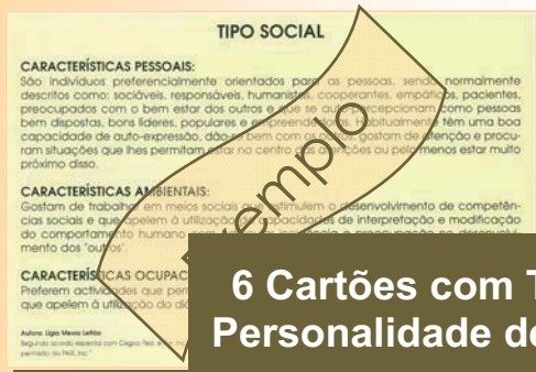
6 Cartões com Tipos de Personalidade de Holland

Em seguida, exploram-se várias hipóteses vocacionais, através da classificação de 120 cartões com descrições de ocupações profissionais .