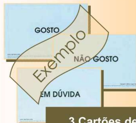
3 Cartões de Preferências