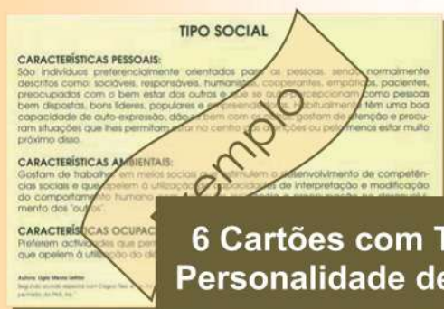
6 Cartões com Tipos de Personalidade de Holland

Em seguida, exploram-se várias hipóteses vocacionais, através da classificação de 120 cartões com descrições de ocupações profissionais .